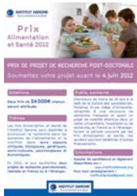
Prix alimentation et santé

L'appel d'offres Institut Danone en collaboration avec La Fondation pour la Recherche Médicale est lancé tous les deux ans en alternance avec les Prix Alimentation et Santé.